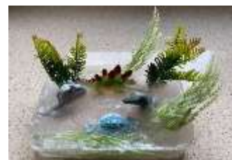
z čias dinosaurov

Aby sme počas mrazivých dní v mesiaci február nemuseli zostať zamrznutí iba pri obrazkách, pani učiteľky nám ukázali príležitosť, ako si aj tvorivo užiť radosť z ľadu a zároveň zistiť mnoho užitočného. Ponorili sme sa do sveta fantázie, využili sme dary prírody a zamrazili rôzne rastlinky, konáriky, či iné drobné predmety a vytvárali sme krásne príbehy ukryté do ľadu. Popri tom sme skúmali zmenu skupenstva vody, teplotu, pri ktorej voda zamrzá, pri ktorej sa topí, ktorá voda zamrzne rýchlejšie - slaná alebo čistá a mnoho iného. Naša detská tvorivosť a fantázia mnohých iste prekvapila i potešila.