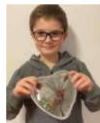
aj ľadové srdiečko dokáže zohriať