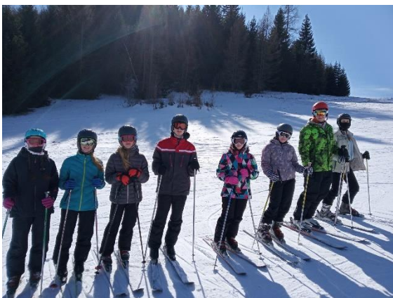
Žiaci 2. ročníka

Lyžovaniu zdar! Športu zdar! Aj takýmto spôsobom sa posilňuje vzťah našej mládeže k športu a k pohybu.