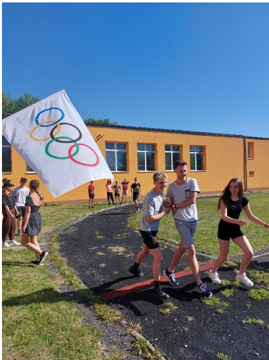
Študenti odovzdávajú štafetu

Dňa 23. júna 2022 sa u nás v škole organizovala Chôdza olympijského dňa, na ktorej sa zúčastnili žiaci všetkých tried 1. -3. ročníka.