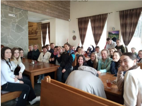
Žiaci 2. ročníka

bol síce obmedzený a uprednostnili sa tí, ktorí boli zaočkovaní a prekonaní, záujem zo strany žiakov 2. ročníka určite bol. A tak v týždni od 28. 02. do 03.03. 2022 sa zorganizoval lyžiarsky výcvik aj pre nich. Na rovnakom svahu, v rovnakom lyžiarskom stredisku a v tom istom hoteli Studničky vo Vernári. Žiakov 2. ročníka bolo cca 50.